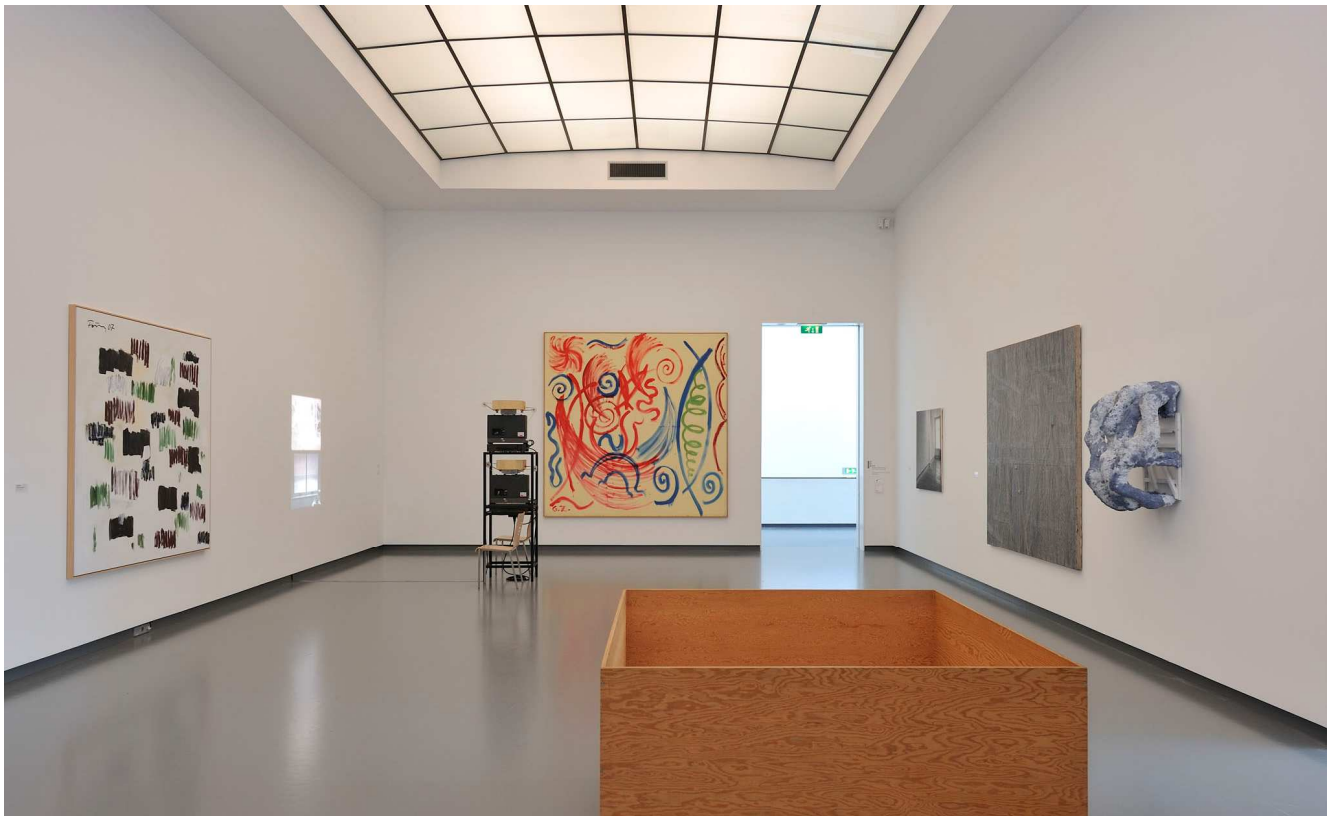
Zaaloverzicht Plug In #41 met werken van Förg, Van Warmerdam, Penck, Dibbets, Preesman en Judd. Foto Peter Cox.

titel Storing aflevering Plug In #41 looptijd van 09-05 t/m januari 09 conservator Rudi Fuchs tekst geschreven door Rudi Fuchs fotograaf Peter Cox