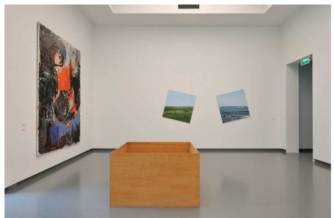
Zaaloverzicht Plug In #41 met werken van Penck, Dibbets, en Judd.